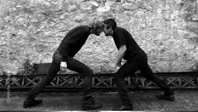
Dimanche Rouge