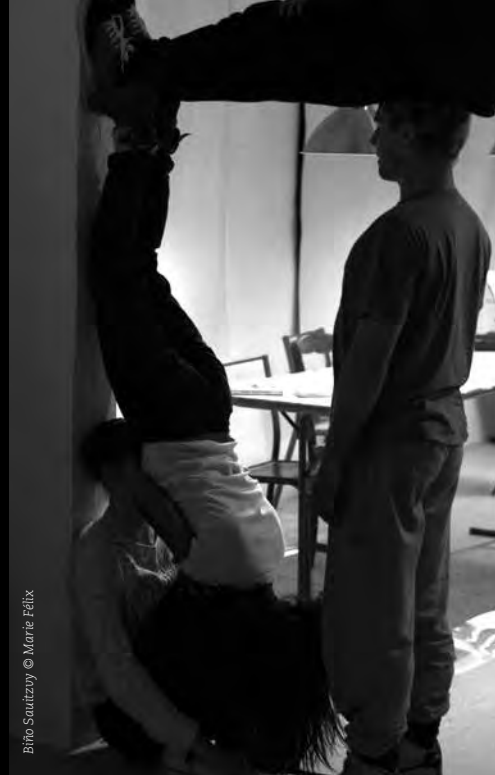
BiRo Sautzoy © Marie Félix