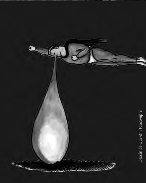
Dessin de Quentin Faucompré

Sens 2 : Un inclassable ouvrier de boîtes et de pistes. Une philosophie nourrie au lait de Buster Keaton, par des gags audio-verbaux-visuels.