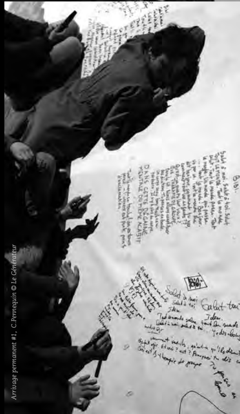
Arrivage permanent #1, C. Pennequin