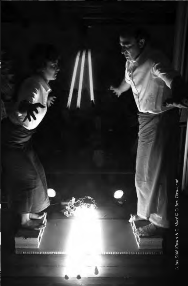
Lotus Eddé Khouri & C. Macé