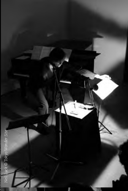
Neil Luck © Tobyo Wonder Site