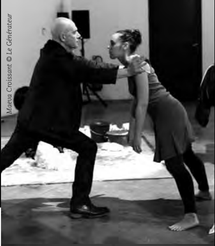
Moëna Croissant © Le Générateur