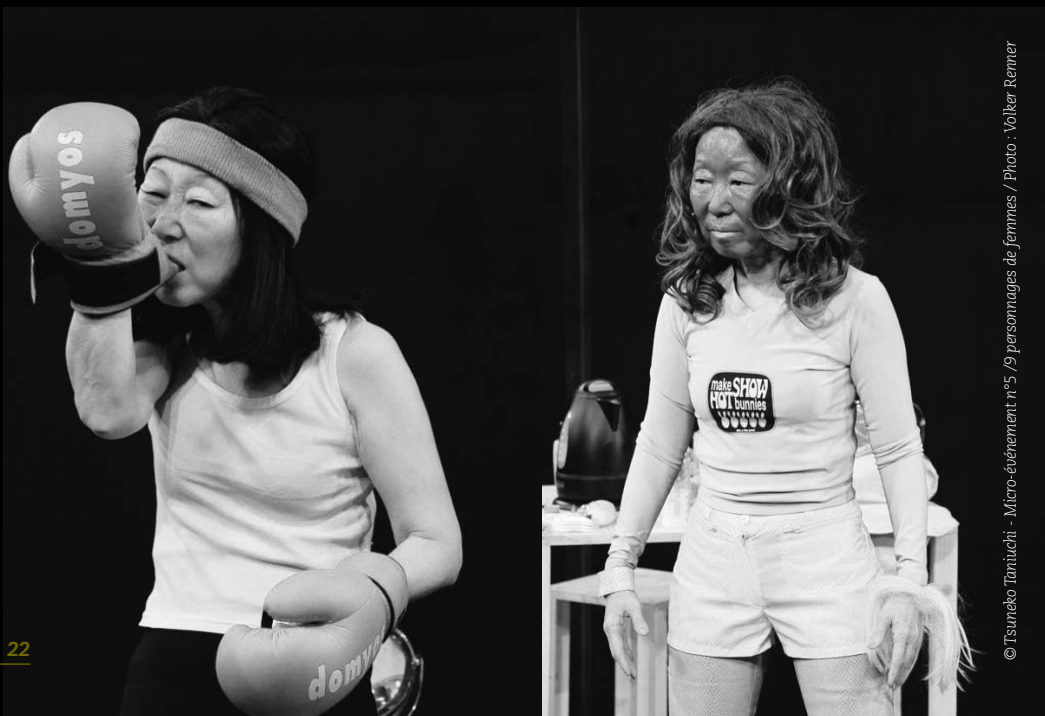
© Tsuneko Taniuchi - Micro-événement n°5 / 9 personnages de femmes