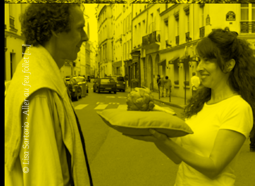
© Lisa Sartorio - Aller au feu joliet