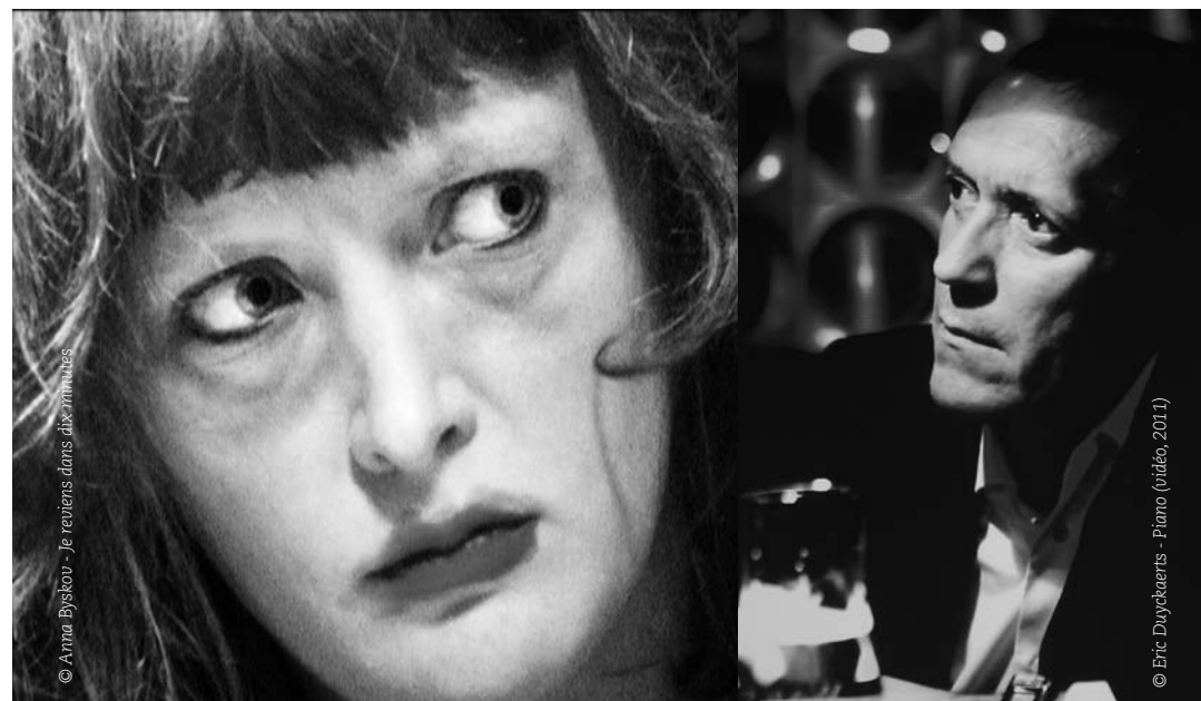
© Anna Byskov - Je reviens dans dix minutes

Mais pendant 24 heures, sous le signe du partage et de l'écoute, attendons-nous à une expérience des plus décalée pendant laquelle nous seront offertes des denrées en tout genre, sonores et artistiques mais aussi culinaires (ne faut-il pas tenir 24 heures ?).