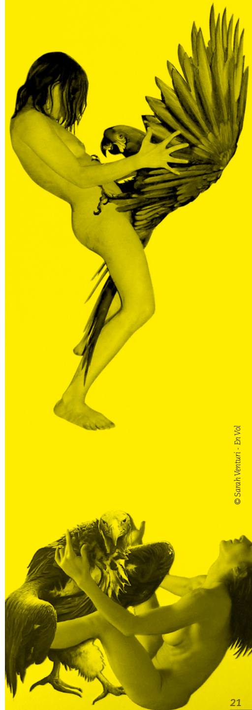
© Sarah Venturi - En Vol

À partir du 21 octobre 2011, le MAC/VAL présente les travaux photographiques de Tsuneko Taniuchi dans Parcours #4, «Nevermore», nouvel accrochage de la collection du musée proposé régulièrement par le MAC/VAL.