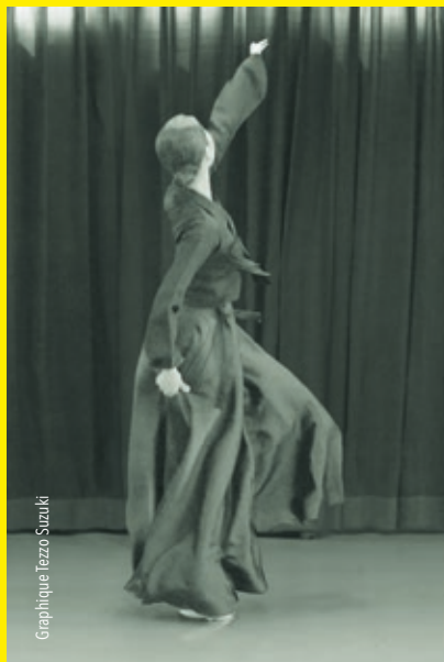
Graphique Tezō Suzuki

Exposition The Wall - 16 oct. > 15 déc.2022 au Cneai