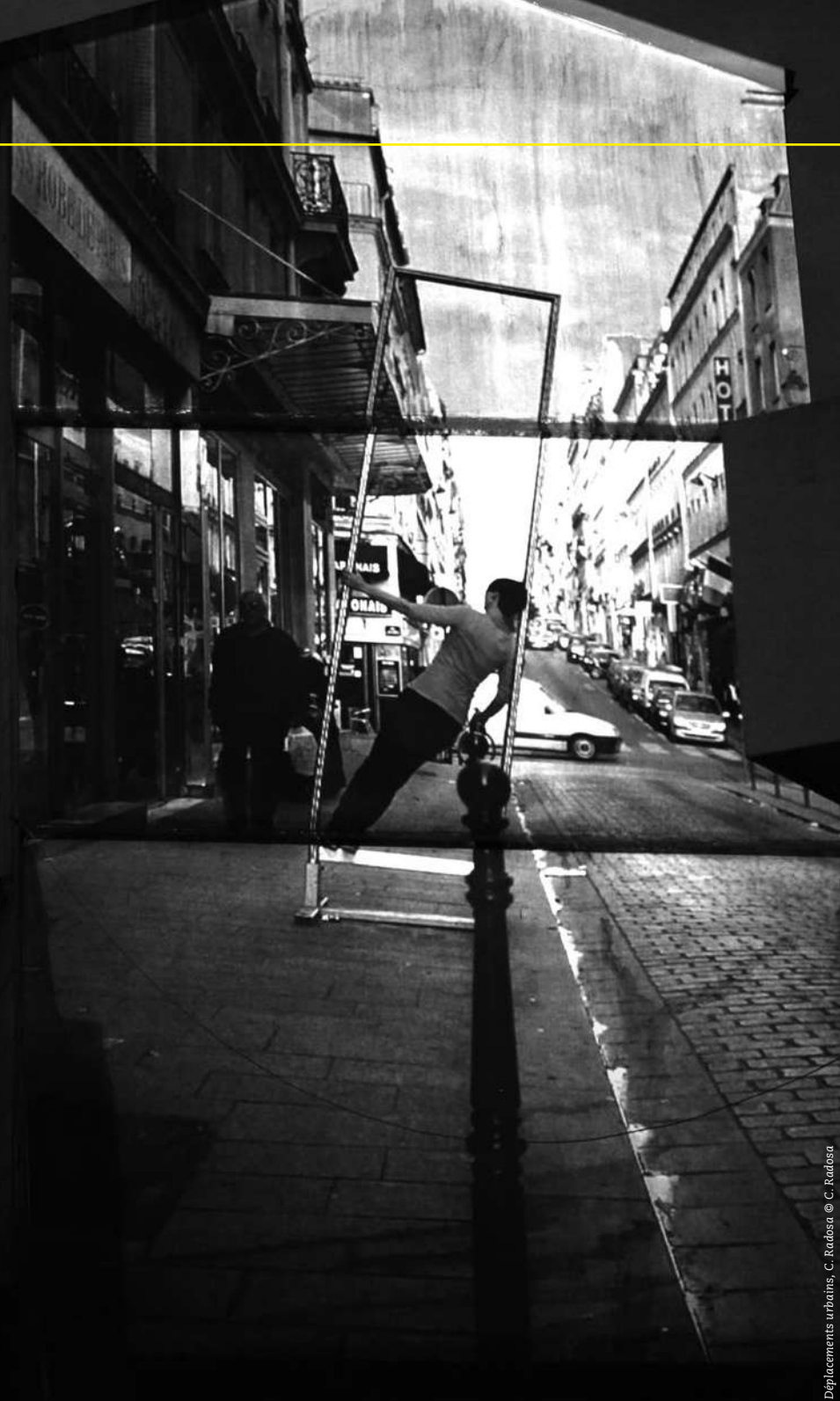
Déplacements urbains, C. Radosa © C. Radosa

Projet porté par Projectile en partenariat avec Grande Image Lab / ESBA TALM (Ecole supérieure des beaux-arts Tours Angers Le Mans) et ETC.