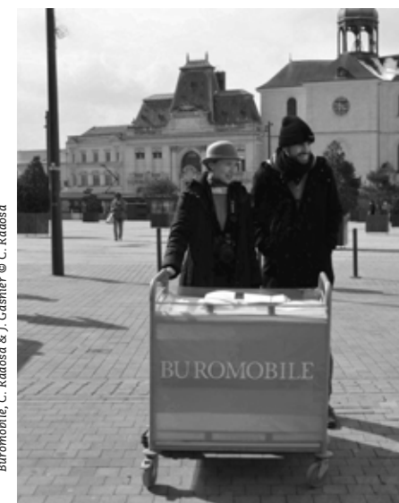
Buromobile, C. Radosa &amp; J. Gasnier

Dans le cadre de P/P#13 LE GENERATEUR, Catherine Radosa présente sa nouvelle vidéo Rue de l'égalité.