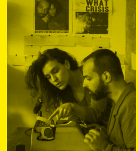
Y Liver ©DR