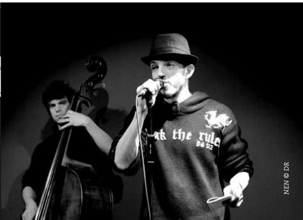
NEN © DR