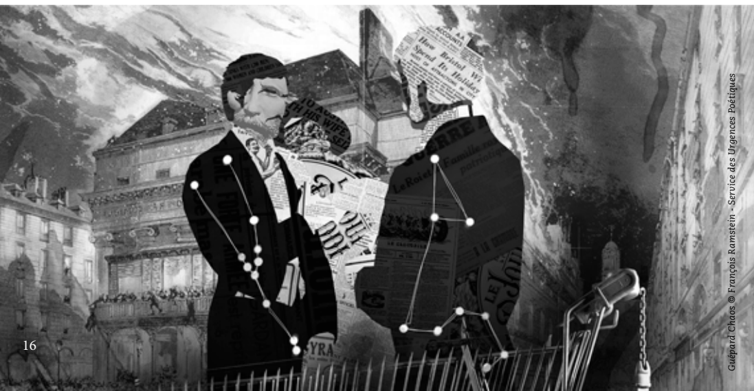
Guépard Chaos