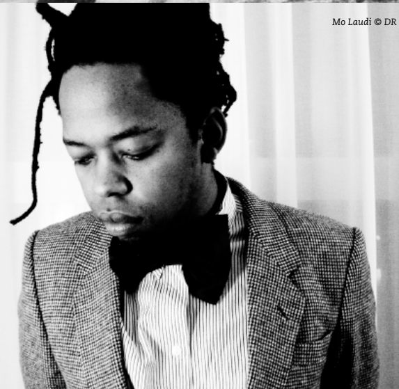
Mo Laudi © DR