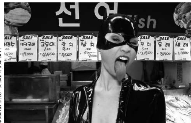
© Marcus Kreiss - Souvenirs from Earth

Autre date de Souvenirs from Earth pendant FRASQ : 27 oct > Le Bal rêvé