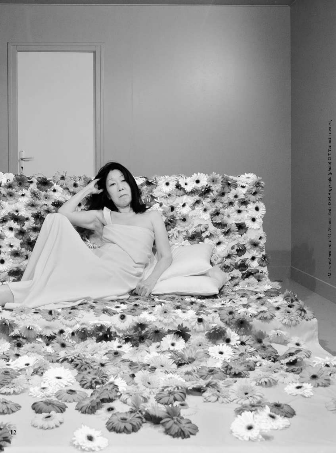
«Micro-événement n°41 / Flower Bed» © T. Taniuchi (œuvre)