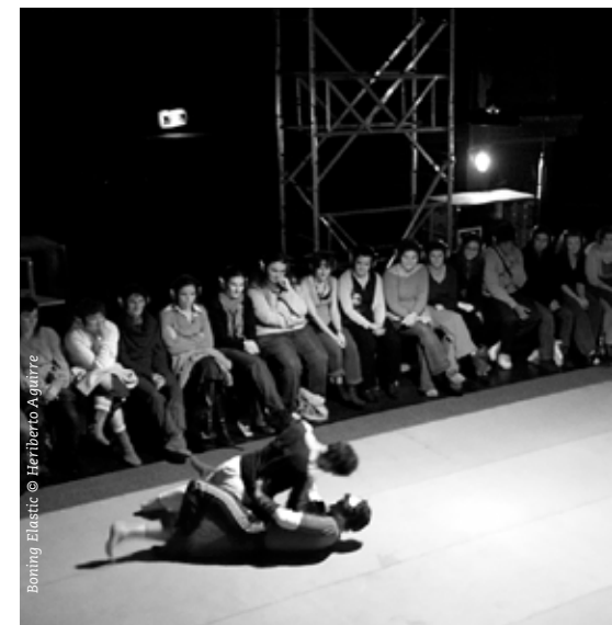
Bonding Elastic © Heriberto Aguirre