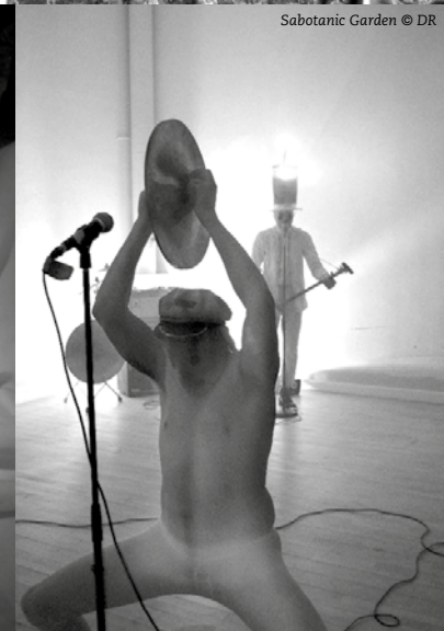
Sabotanic Garden