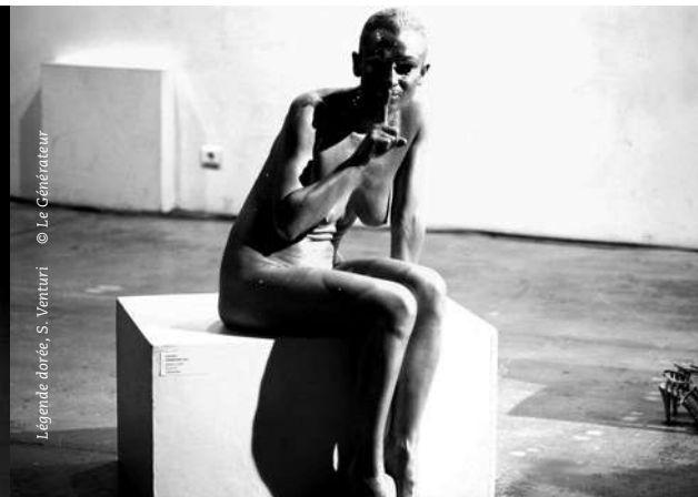
Légende dorée, S. Venturi