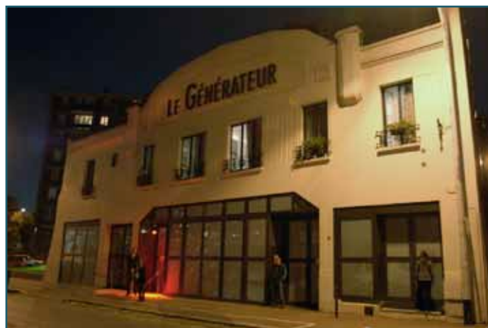
Nuit Blanche 2007, Marina Abramovic © Le Générateur