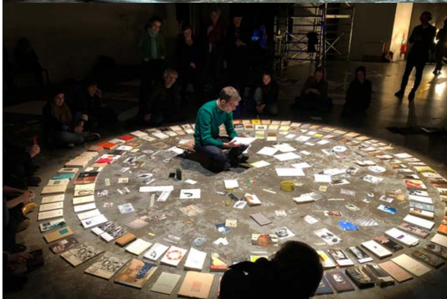
Ici Remue - François Durif