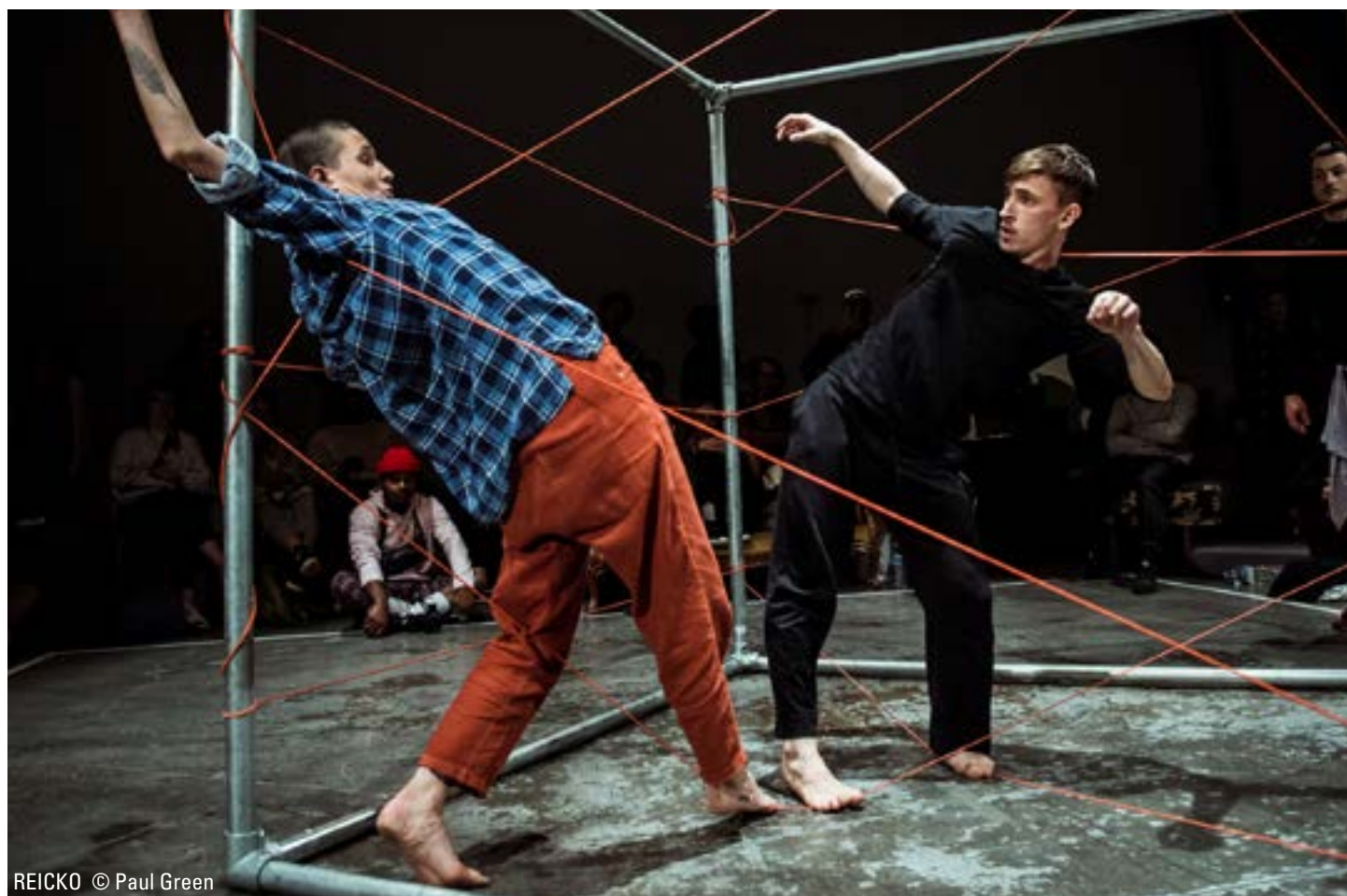
REICKO © Paul Green