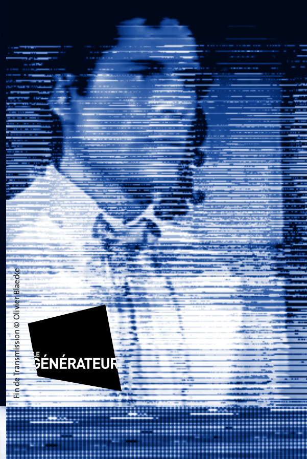
Late Speculation, Nonotak Studio, Le Générateur