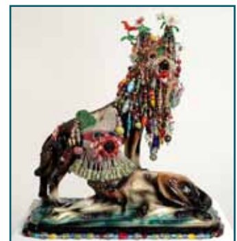
Blondi und Eva, 2012 - Skall