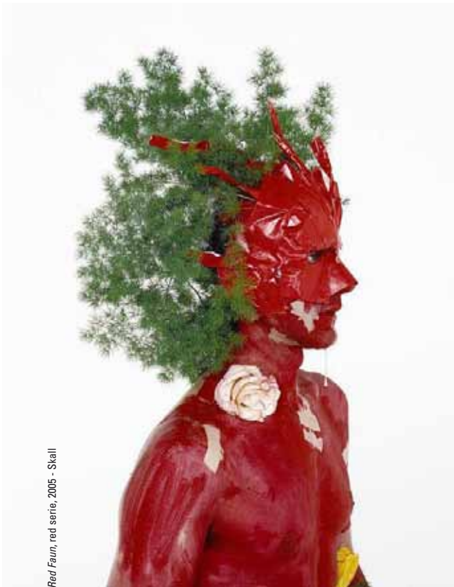
Red Faun, red serie, 2005 - Skall

Arts plastiques - Photographies - Sculptures - Vidéo - Performance