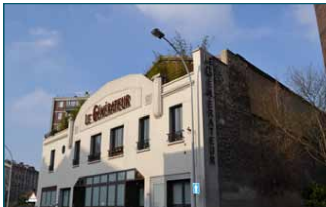
Le Générateur

Le Générateur est un espace géré par des artistes. Lieu d'incubation rapide et de catalyse très neutre, c'est l'invitation à un voyage sans destination fixe, sans autre objectif prédéterminé que d'agrandir l'univers des possibilités d'existence.