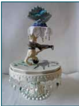
Challenging the moon, 2010 - Skall