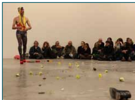
Fucking red shoes, FRASQ 2012 - Skall