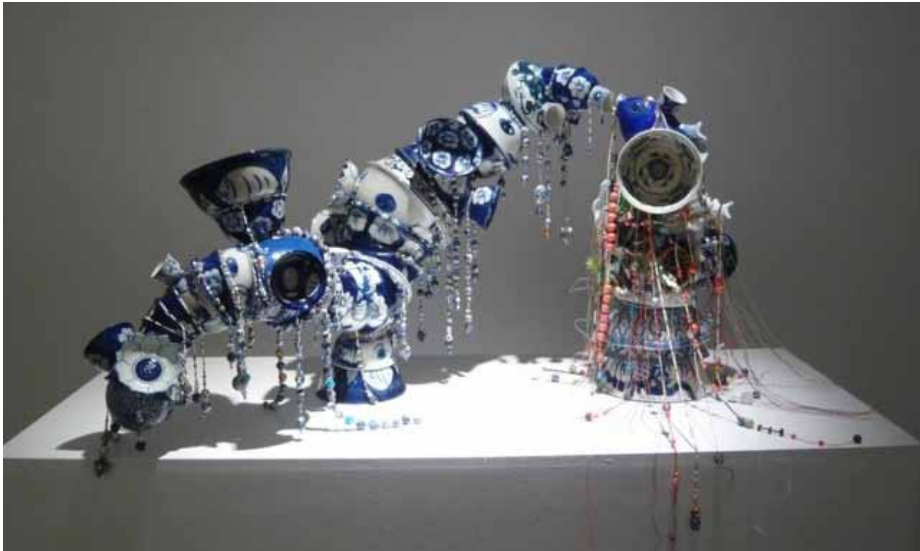
Le mangeur de secrets, 2009 Porcelaine, perles de verre, plastique et pierre, fil de coton, silicone

SKALL connaît bien l'espace du Générateur et dans son souci de dialoguer avec ce vaste volume, il présentera des œuvres aux formats multiples : Sculptures de grande taille, céramiques, photos grand format, vidéos et quelques créations inédites. Dans sa générosité naturelle, SKALL prévoit en parallèle d'ouvrir son exposition à d'autres artistes. Il les invite dans le cadre d'une programmation de performances qui se déclinera sur toute la durée de l'événement.