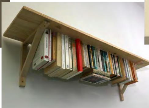
Etagère , Claude Faure © Claude Faure. Courtesy Arthotèque de Caen.