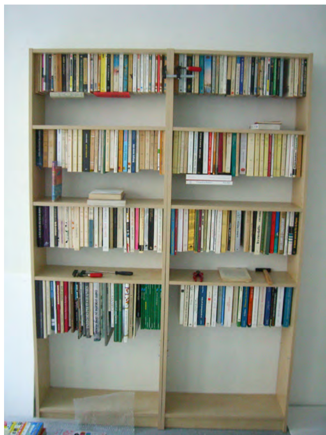
Claude Faure, Bibliothèque

En 1991, la Galerie Bernard Jordan coédite (avec la Cité des Sciences) Pas un mot plus haut que l'autre , petit livre où se rassemblent de nombreux exemples de rencontre entre le sens et la forme des mots écrits. Un peu d'italien, d'anglais, d'allemand, une once de latin offrent autant de variantes goûteuses... Restant attaché à la multiplicité des matériaux, il ne dédaigne pas le papier, la toile, le textile, le miroir, l'objet tout fait et jusqu'aux alphabets en pâte alimentaire. Tout ce qui peut faire signe.