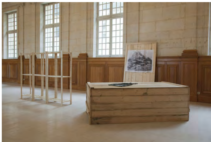
Standard and poor's, Le grand ensemble 2012, bois du nord européen, bois du brésil, sac poubelle recyclable, verre de Murano, tirage papier, dimension variable. © Hugo Renard