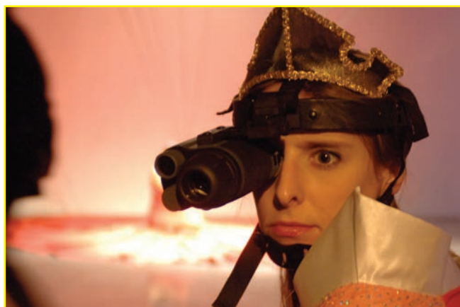
Insomnia / IPG-Marina Abramovic (Nuit Blanche 2007)